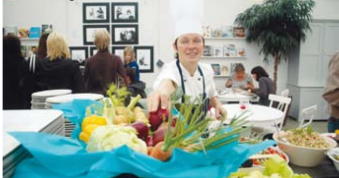
Lilla K's trädgårdskök i Bollnäs.

20. Sopperogården, Övre Soppero. "Vällagade lokala maträtter. Annorlunda miljö, finns inget liknande!" www.sopperogarden.com 0981-301 53