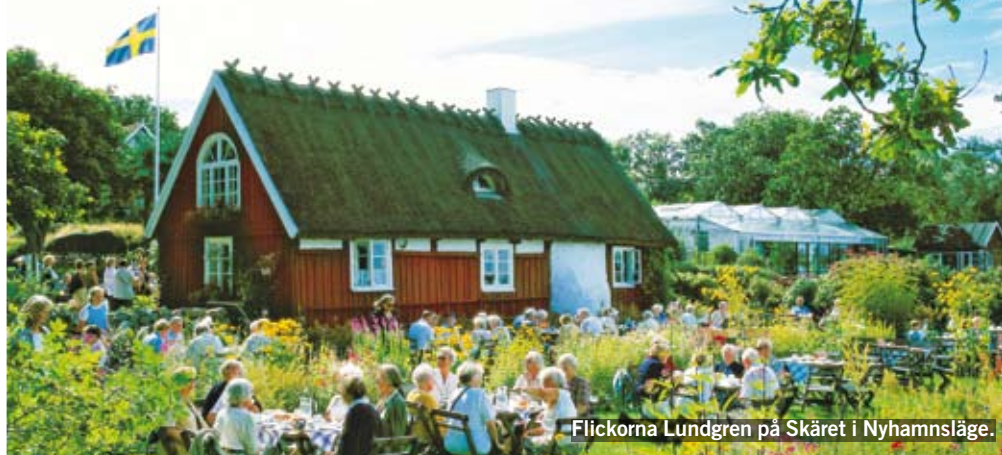
Flickorna Lundgren på Skäret i Nyhamnsläge.

Det finns massor av bra vägkrogar och kaféer från norr till söder. Här är de allra bästa enligt Icakurirens läsare!